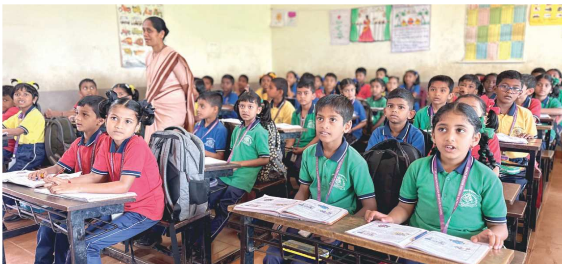
Ve třídách je úplně plno. V některých sedává až 67 dětí.

S Božím požehnáním a vaší velkou pomocí věříme, že vše šťastně zvládneme!