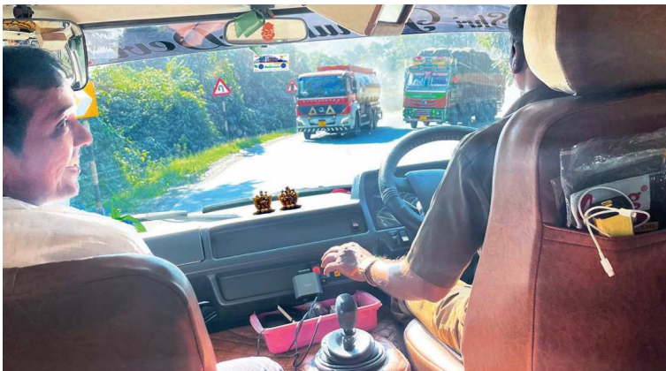
Z dopravy v Indii nám vstávají vlasy na hlavě. Indové se jen smějí.

nepřicházejí. Není výjimkou, že děti mluví čtyřmi nebo pěti jazyky, přepínají mezi nimi naprosto přirozeně.