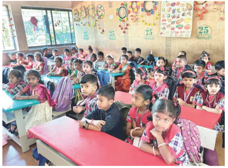
Tolik žáků tedy paní ředitelka ve třídě v Bartošovicích opravdu nemá.