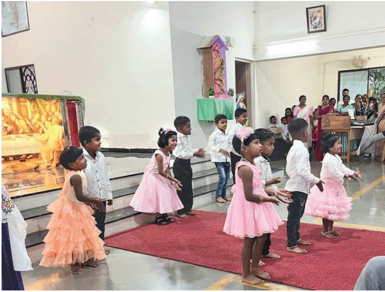
Mše v Indii jsou plné tance a zpěvu.