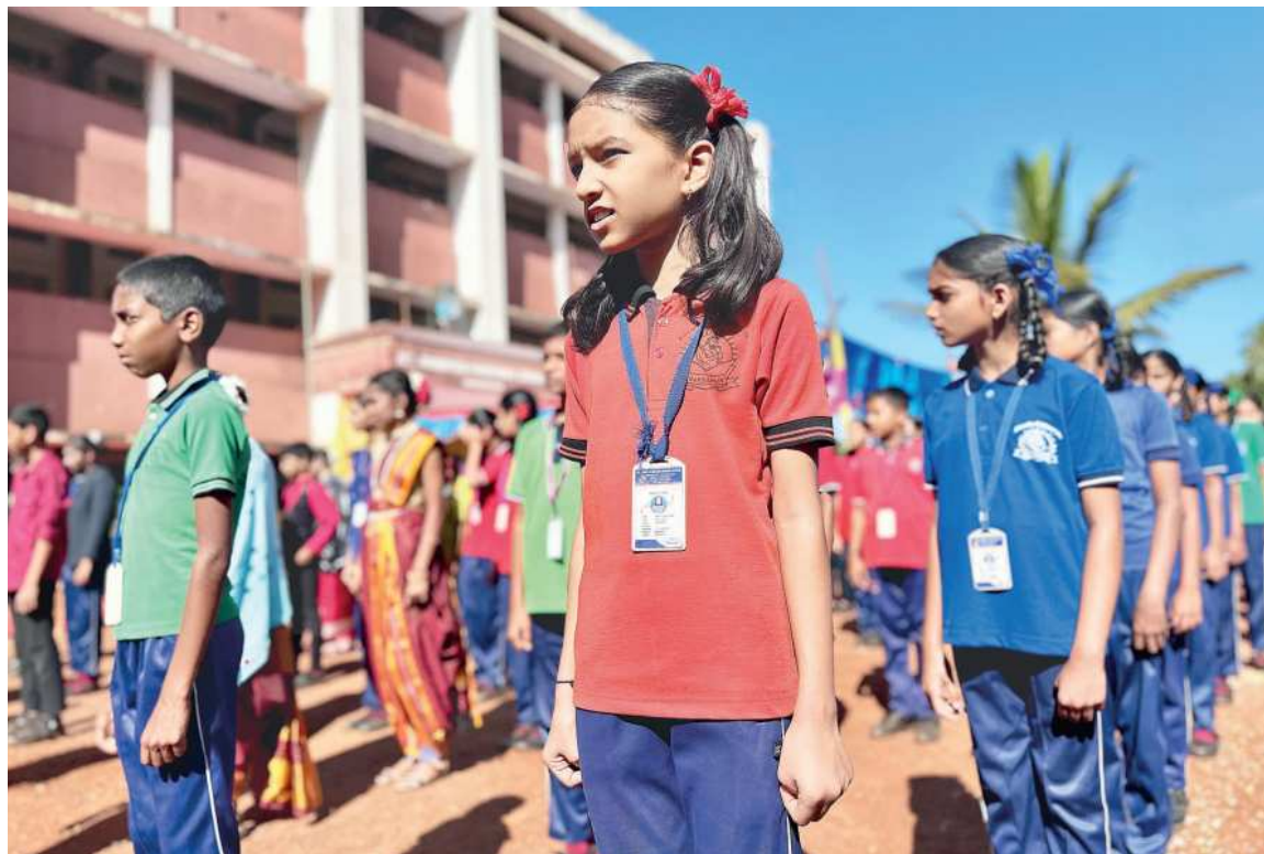
Žáci ve škole sv. Josefa v indickém Mansapuru.

HLEDÁME 1 000 MARIÍ. Když tisíc Marií (s podporou Josefů) daruje po tisíci korunách, pomohou rozšířit kapacitu školy pro chudé děti v Indii, a tím splnit nové požadavky na její provozování. Najděte si svou Marii, se kterou přispějete na tuto sbírku! Děkujeme!