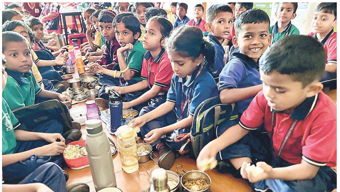
Návštěva z ČR dá zabrat, a tak je potřeba se trochu posilnit.

První, čeho si všimnete po vstupu do školy, je klid. Ne ticho vynucené strachem, nýbrž soustředění. Děti dávají pozor, reagují, zapojují se. Ve třídách jich bývá klidně padesát a bez určitého řádu by to ani nešlo. Přesto to nepůsobí jako vojenský režim. Učitelé jsou přísní, ale spíše důslední než tvrdí. To hlavní, co je za tím cítit, je vnitřní motivace žáků.