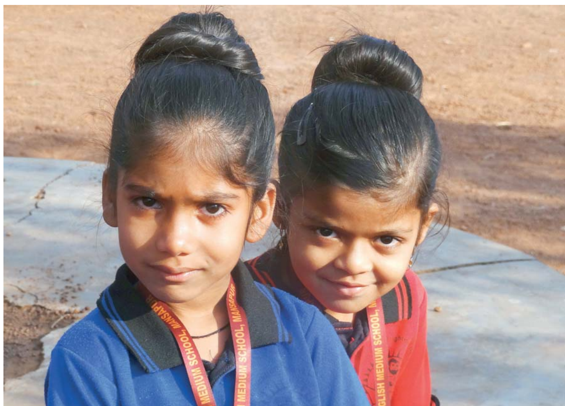
Pomůžete nám, prosím, dostat se až do 12. třídy v naší škole?

Když tisíc Marií (s podporou Josefů) daruje po tisíci korunách, pomohou rozšířit kapacitu školy pro chudé děti v Indii a tím splnit nové státní podmínky pro její provozování. Najděte si svou Marii, se kterou přispějete na tuto sbírku! Děkuje!