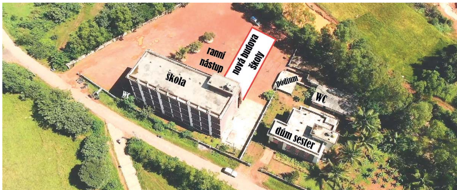
Situační plán celého areálu i s novou budovou školy.

di děkujeme! Všem bychom vám přáli, abyste to osobně v naší škole mohli zažít! Texty v příloze Antonín Nekvinda a spolupracovníci PONS 21