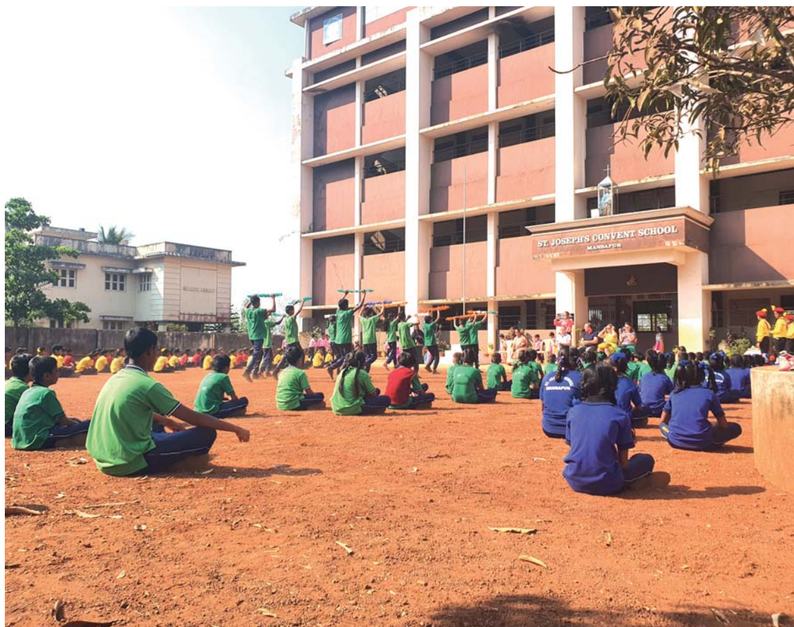
Pohled na roh místa, kde by měla stát další budova školy.

Pomohli jsme udržet chod školy v době covidu – kdy uzávěrka školy trvala skoro dva roky, přesto museli platit na 50 % snížené platy učitelům a zaměstnancům, velmi chudým rodinám sestry pomáhaly s jídlem a základními životními potřebami. Žádné do-