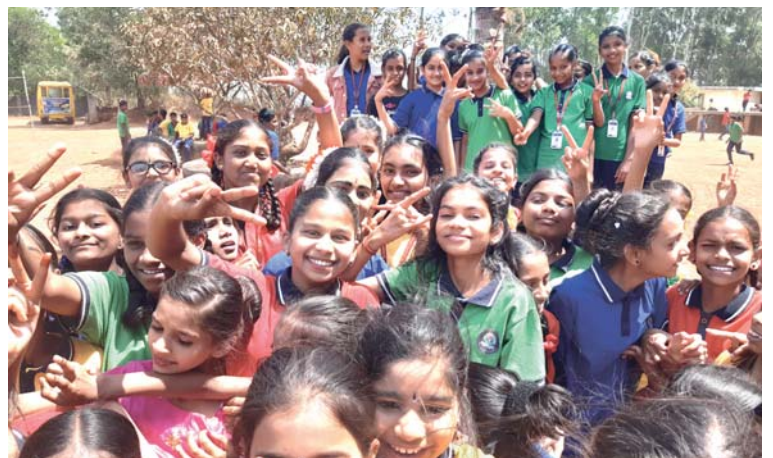
Děti zatím mají polední přestávku a starosti nechávají na dospělých.

Až v nebi uvidíme, kolik dlužíme chudým, že nám pomohli lépe milovat Pána Boha. (Matka Tereza)