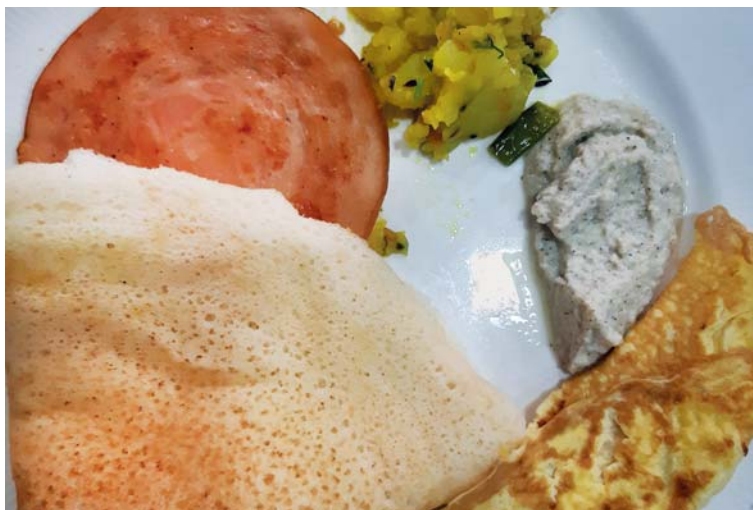
Appam na snídaněm talíři se salámem, brambory, vaječnou plackou a nějakým dressingem. Toto ovšem opravdu není běžná snídaně našich přátel...