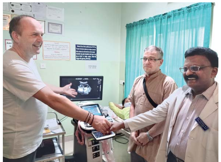
Vloni jsme podpořili pořízení ultrazvuku a mohli vidět jeho použití. Za K. Kratochvílem vykukuje spokojená maminka, která slyší tlukot srdce svého miminka.

Největší chudoba nastává ve chvíli, kdy nám začnou věci poroučet. (Matka Tereza)