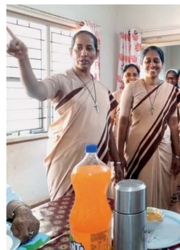
Sestry nám s úsměvem ukazují, že už máme jít do školy.

Bud' projevem laskavosti; měj laskavost ve tváři, v očích, v úsměvu, ve vřelém pozdravu. (Matka Tereza)