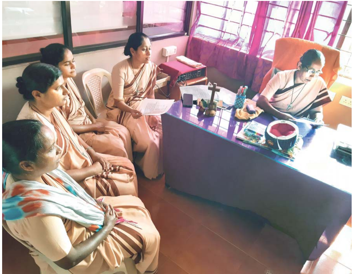
Sestry v čele s provinciálkou nás seznamují se stavem věcí.

Tuto zprávu jsme vyslechli vcelku s úžasem a v duchu děkovali za náš vzdělávací systém a podmínky pro podnikání... Sestry se nepřestaly usmí-