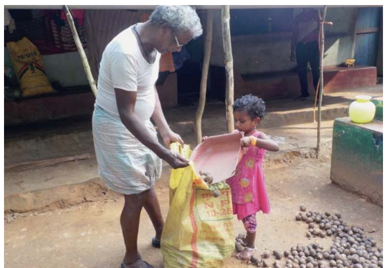
Děvčátko pomáhá tatínkovi zvednout produktivitu práce.

Jestli se domníváš, že celý svět je špatný, pak si uvědom, že se skládá i z lidí, kteří jsou jako ty. (Mahátma Gándhí)