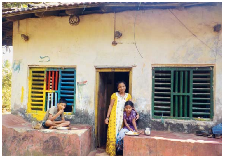
Ale u maminky je u maminky...

Až se vaše země a moje země sejdou na naukách stanovených Kristem v tomto Kázání na hoře, pak vyřešíme problémy nejen našich zemí, ale zemí celého světa. (Mahátma Gándhí)