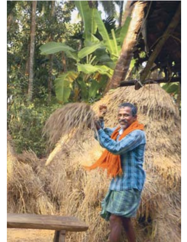
O mechanizaci si mohou nechat zdát. Ostatně by jim brala práci.