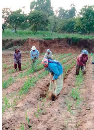
Dřina na poli s cukrovou třtinou.

Typickým zaměstnáním rodičů vesnických dětí je práce na poli. Jde o práci, za kterou dostávají denní výplatu asi 100 rupií, což je asi 35 Kč. Nemají vůbec jisté, že práci další den budou mít, ale mají jistotu, že z takové mzdy nic nenašetří na časy horší. Jak se s tím dá v covidové době přežít? Není divu, že se lidi snaží přivydělávat všemi možnými způsoby a že přesto pocítovali hlad a zmar. My si vůbec nedovedeme představit, že bychom něco takového vydrželi.