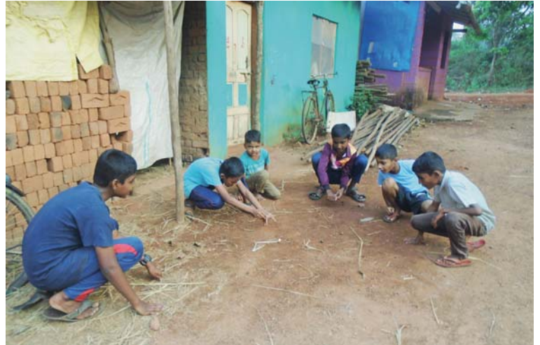
Kluci se zdokonalují v ručních pracích náročnou společenskou hrou.