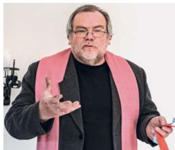
Při pozhnání. Snímky v příloze archiv PONS 21

Oči těchto dětí, kterým jsme dali naději na nový lepší život, když jsme pomohli postavit školu, mi stále opakují tu původní otázku: Co bude dál? Bude škola?