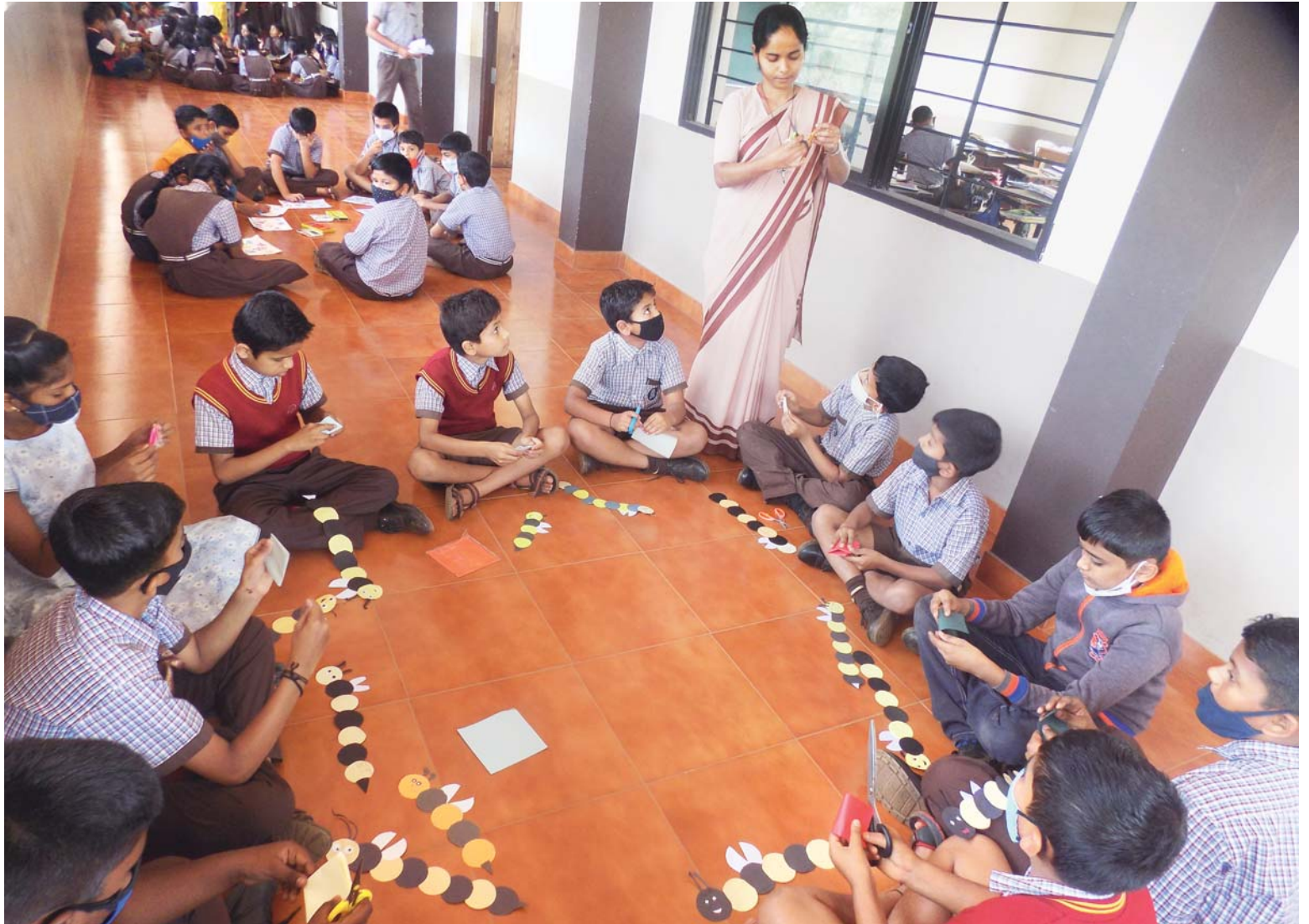
Škola hraje. Venkovní chodba poskytuje dostatek prostoru pro pobyt na vzduchu spojený s výtvarným snažením. Vyučující jsou i řádové sestry a dělaly maximum proto, aby se dodržela epidemická pravidla a zároveň se mohlo vyučovat.

internetovým spojením, nebo s žádným, zejména ve venkovských oblastech. K tomu máte negramotné rodiče a tak snad není třeba dále vysvětlovat, jak asi „distanční“ výuka probíhala.