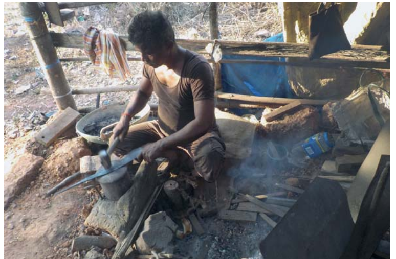
I takhle může vypadat kovárna.