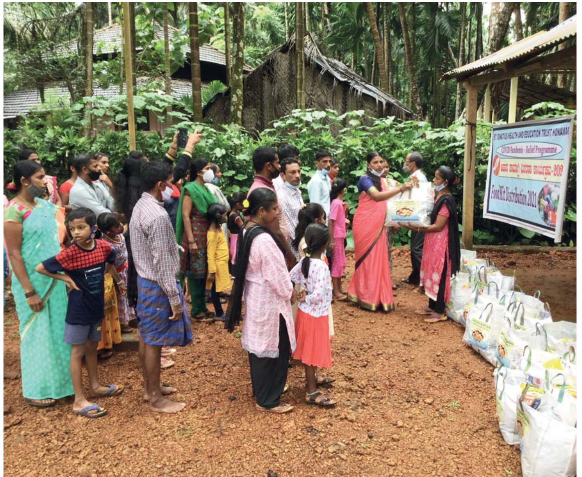
Rozdávání potravinových balíčků na vesnici.

Během návštěv domovů při rozdávání základních potravin jsme narazili na tolik rodin na prahu hladu a hladovění. Potravinové balíčky byly pro ně vzácným darem. Mnozí byli bez práce. Navštívili jsme několik rodin a vzpomínám si na jednu kon-