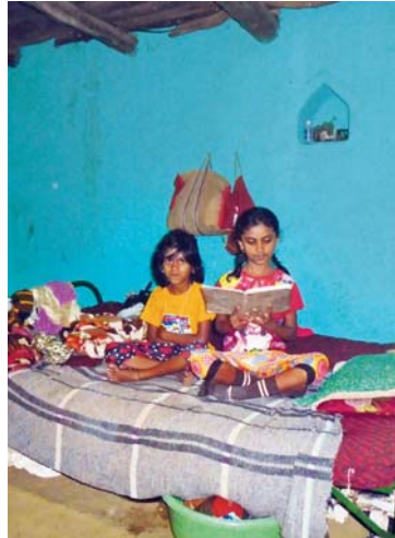
Děvčata se doma vzorně učí, chlapce se takto vyfotit nepodařilo.

Z následujících fotografií je patrné, že když děti můžou na vesnici ven, je o zábavu postaráno! A že k tomu nepotřebují tablety ani mobily, a už vůbec ne dohled dospělých. Kéž by to už dále nebylo jinak!