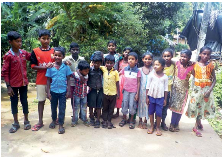
Na lotroviny je nejlepší naše parta!