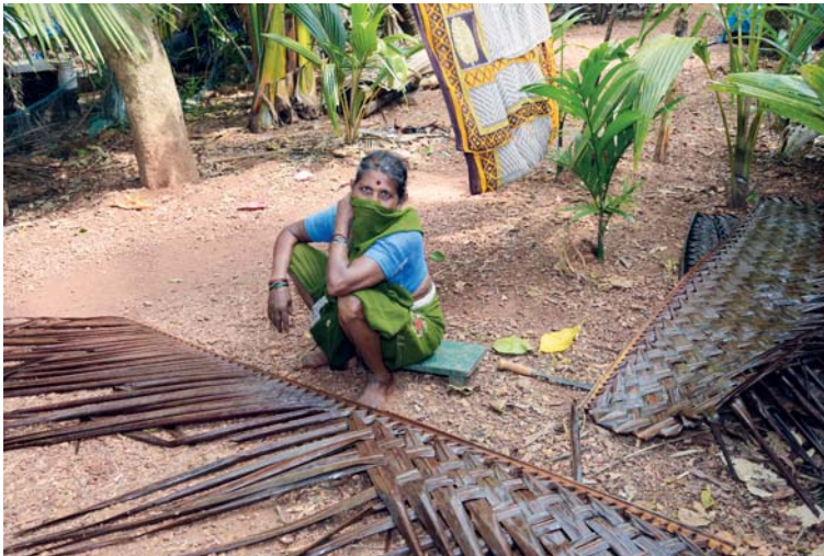
Šikovné ruce umí udělat rohože téměř z čehokoliv.