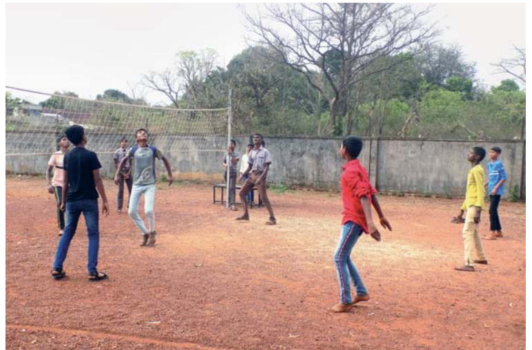
Co asi letělo kolem, že to mládencům nechce vrátit míč na hraní a oni se tváří tak vyjeveně?