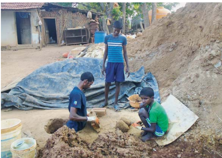
Kluci se od tatínka učí, jak vyrábět cihly.