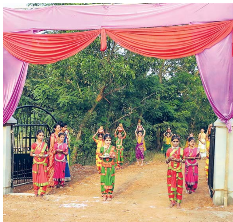
Brána je postavená pouze na slavnostní chvíli, dívky mají kostýmy pouze pro tento okamžik. Zážitek z celé slavnosti je pro všechny na celý život.