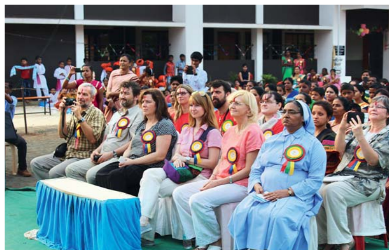
Otevření školy se zúčastnili někteří ředitelé charit královéhradecké diecéze. Charita částí Tříkrálové sbírky podpořila i výstavbu školy.