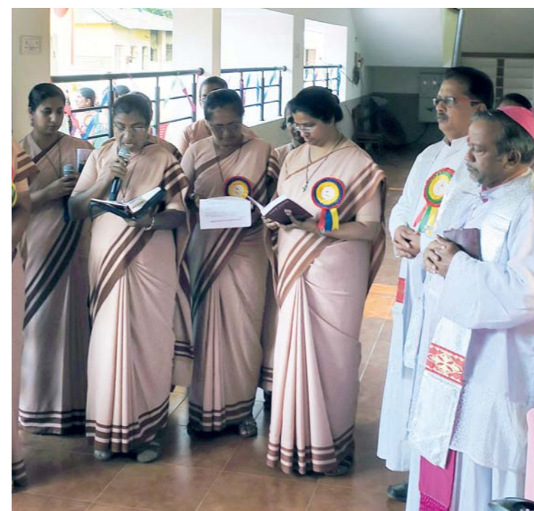
Při obřadu požehnání školy sehrávaly důležitou roli i řádové sestry – což ostatně platí úplně o všem, co se školy týká...