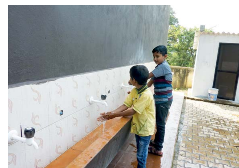
I umývárnu mají děti pod širým nebem.