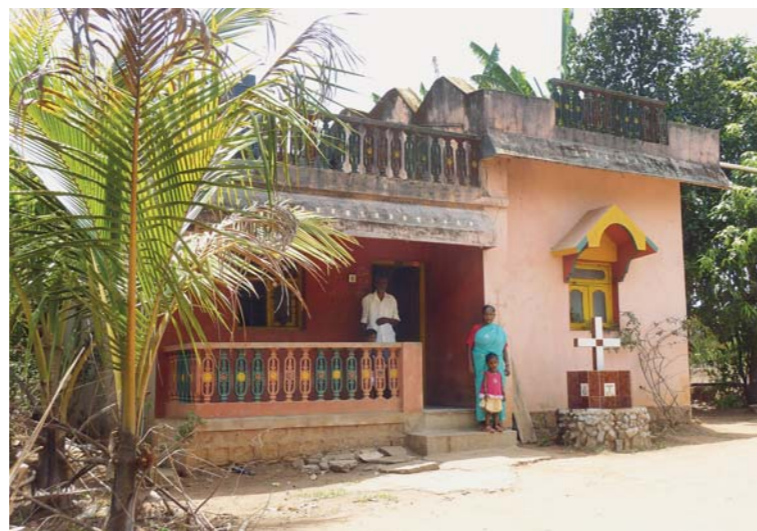
Křesťané svoji víru neskrývají...

Prvním důležitým krokem pro rozvoj Mansapuru byla stavba kostela sv. Josefa, která se povedla hlavně díky aktivitám Mons. Josefa Suchára a zorganizování sbírky „1000 Josefů“. Následně se sdružení PONS 21 zasloužilo o stavbu školy pro 500 chudých dětí z Mansapuru a širokého okolí, která stojí v sousedství kostela. Kromě mnoha jiných peněžních darů dokončení stavby významně pomohl výtěžek ze sbírky „1000 Marií“. Všechny peníze přišly z ČR.