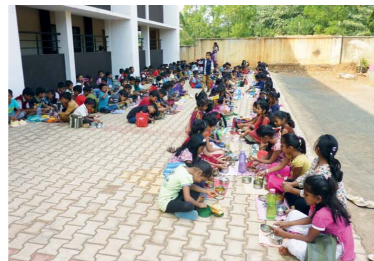
Chodník, který slouží zároveň jako jídelna, občas i jako hřiště.

Kdybyste pokračovali po cestě dál, dojdete do vesnice Mansapur, ale vy zahnete před školou doprava, projdete brankou a ocitnete se na velkém školním dvoře. Ten je opravdu velký, protože je tam každé ráno v 10 hodin (kromě nedělí a prázdnin) nastoupeno skoro 500 dětí na ranní společný program. Ten se skládá z různých modliteb, zpěvů a vystoupení, při re-