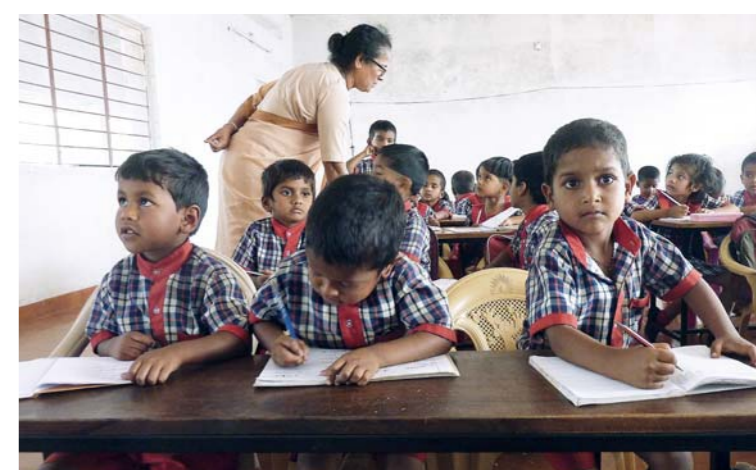
Ovšem škola je hlavně na učení, a tak už druhý den po slavnosti paní ředitelka dohlížela na to, aby byla škola „základem života“...