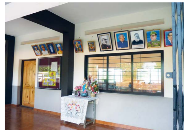
Hlavní vchod do školy.

Po návštěvě školy vás úplně přirozeně napadne přejít cestu a chvíli posedět v blízkém kostele. A kromě jiného budete určitě děkovat za to, že můžete žít v naší krásné zemi společně s lidmi, kteří dokáží pomoci potřebným v takové dálavě. A přemýšlet o tom, proč vás to napadá až v Indii.