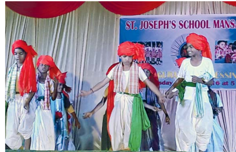
A v Indii se rádi tanečně činí i páni kluci. Při slavnostním otevření nové školy tak jejich vystoupení nemohlo chybět.