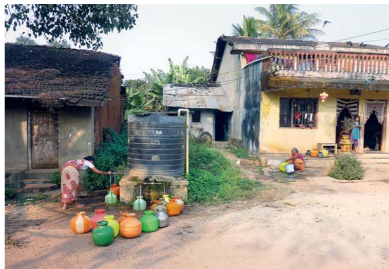
Zásobník na vodu je pro místní životně důležitý.

Indická vesnice Mansapur je stejně jako řada jiných v této zemi velice chudá, ale krásná obec obklopená políčky a džunglí, jejíž obyvatelé se živí převážně zemědělstvím. Na rozdíl od ostatních vesnic se zde většina obyvatel hlásí ke křesťanství – celých 80 %.