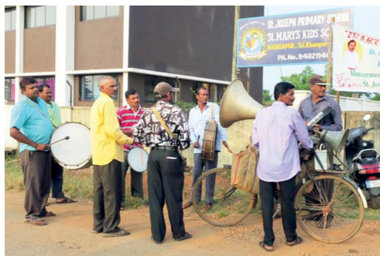
U každé slavnosti v Indii musí být řádná kapela!