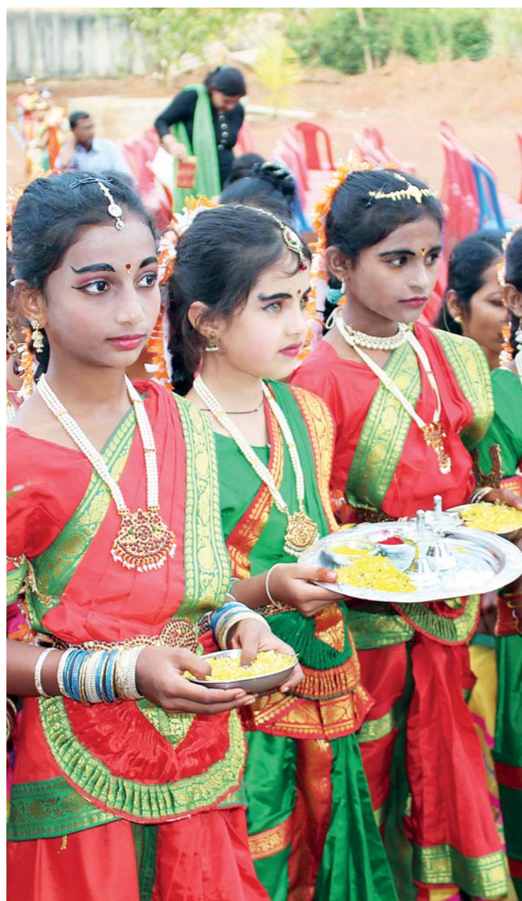
Indie je země barev a při slavnostech jimi hýří nejen oblečení, ale i obličje dívek.