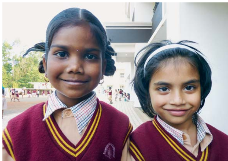
Radostné úsměvy žáků. Konečně mohou chodit do pěkné školy poblíž domova.

Když je budova hotová, všichni jsou šťastní – sestry, studenti, učitelé, zaměstnanci i rodiče. Pro studenty je radost a prestiž chodit do takové krásné nové školy, pro učitele rovněž a navíc jim ubylo organizačních povinnos-