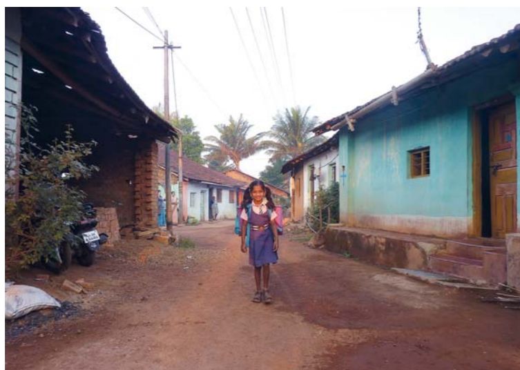
Typická mansapurská ulice.