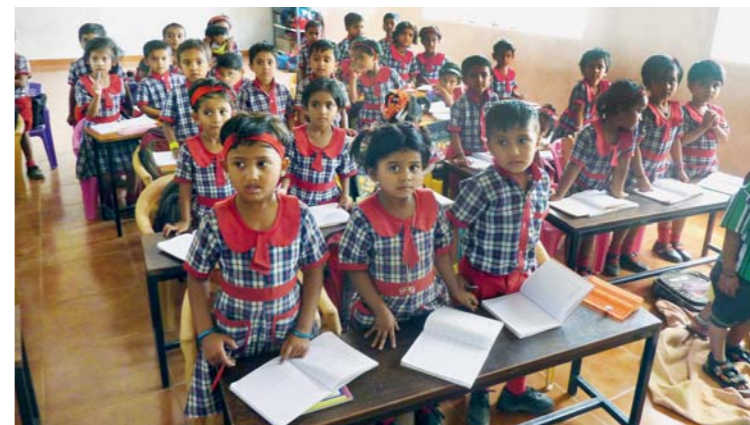
Žáci a jejich školní uniformy. Díky nim je hned jasné, do jaké školy patří.

Požádali jsme naše dodavatele, aby dokončili stavbu. Díky zaplacení poloviny stavby jsme mohli požádat o úvěr na druhou polovinu stavby. To se nám podařilo a nyní budeme úvěr hradit for-