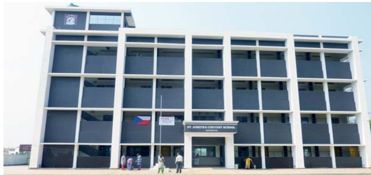
Škola už stojí!

Řádovým sestram, které školu provozují, se podařil vskutku husarský kousek – přesvědčit stavební firmu o dostavění školy i zaplacení zbytku prací (asi poloviny) formou úvěru. Dohnat argumenty a svojí neústupností stavební firmu k dosta-