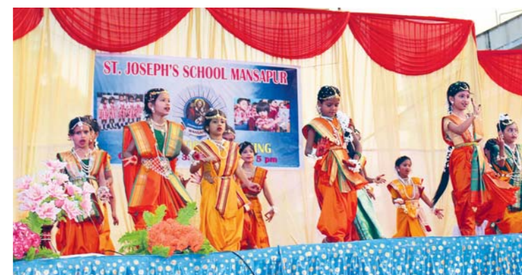
A pak se slečny mohly předvést před velkým publikem hostů se svými tanci.