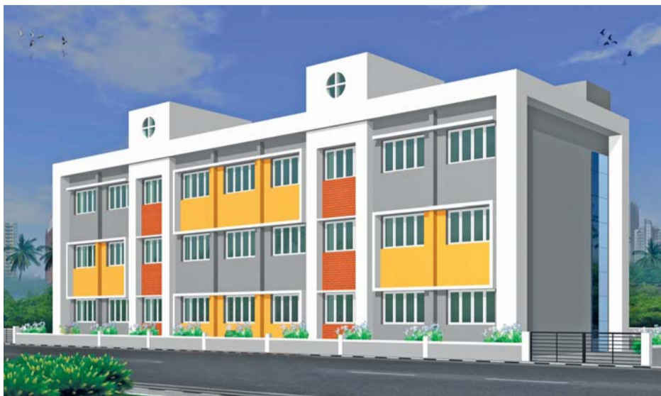
Takto by měla škola v Mansapuru vypadat po dokončení.

A jak se do nové školy v Mansapuru těší budoucí žáci? Přečtěte si, co vzkázali dětem do České republiky.