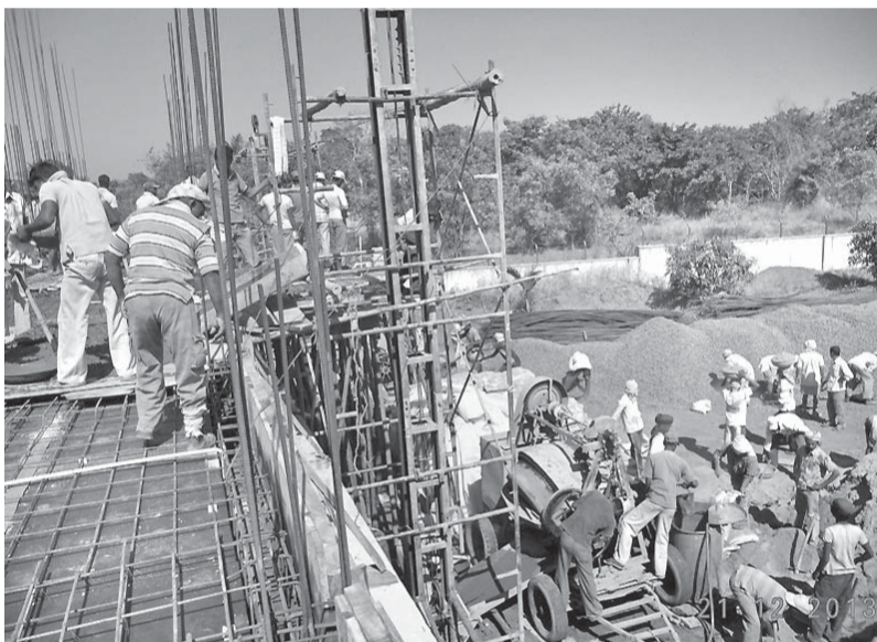
Stavební ruch na místě budoucí školy sledují místní s velkou nadějí.