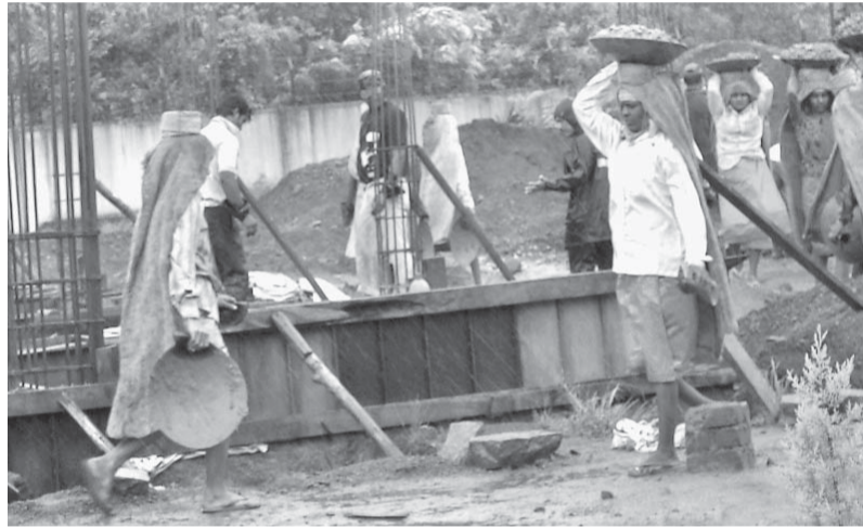
Místní ženy pomáhají na stavbě v období dešťů.