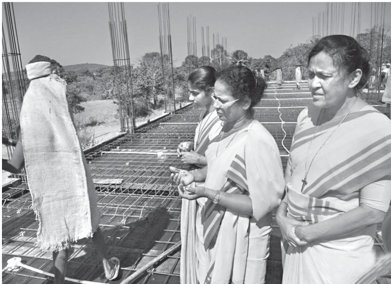
Sestry na stavbu nejen dohlížejí, ale i se za ni modlí.

S radostí sledujeme, jaký pokrok škola udělala, stavba jde rychle a je kvalitní. Lidé z vesnice jsou školou nadšení, jsme na