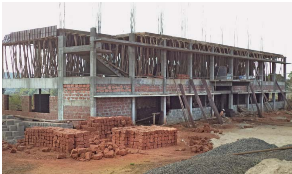
Díky vašim darům stavba roste obdivuhodnou rychlostí.