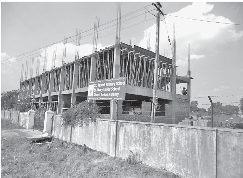
Panna Maria a svatý Josef: patroni nově vznikající instituce.

ni pyšni a těšíme se, že bude brzy dokončena.