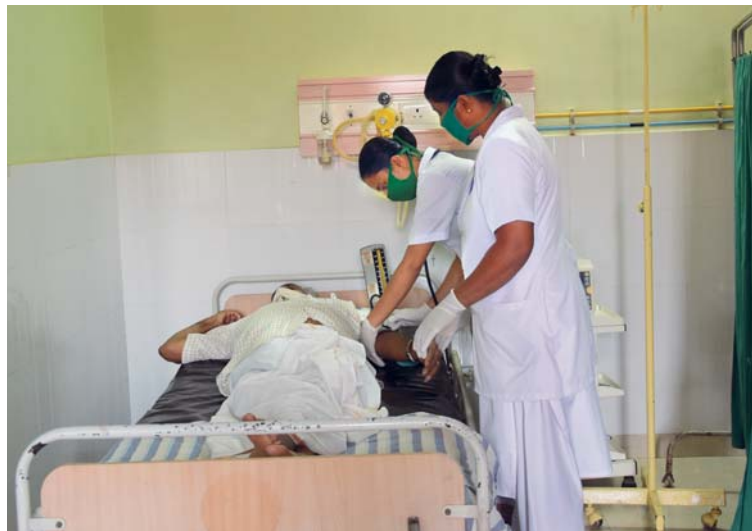
Sestřičky v nemocnici Marie Goretti.