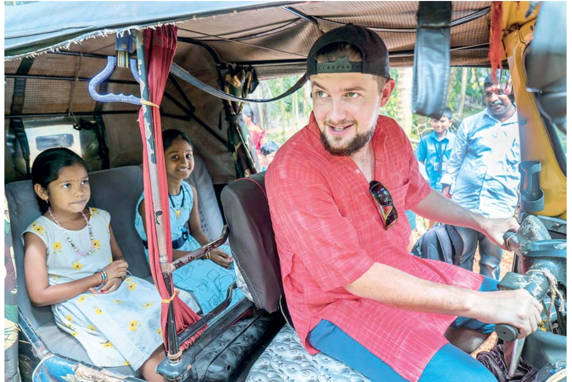
Děti doufají, že se pan fotograf nerozjede...

Školu provozuje katolická Kongregace Panny Marie, Královny apoštolů, ale křesťané pomáhají všem bez rozdílu vyznání. Řádové sestry, které