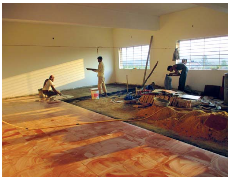
Odbornější práce mohli provádět i místní muži.