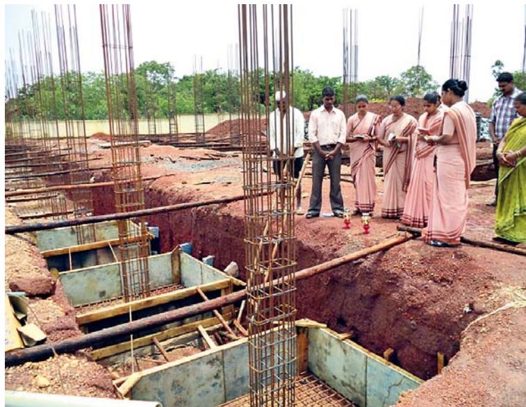
Sestry dohlížely na stavbu a zároveň se modlily za její dokončení.