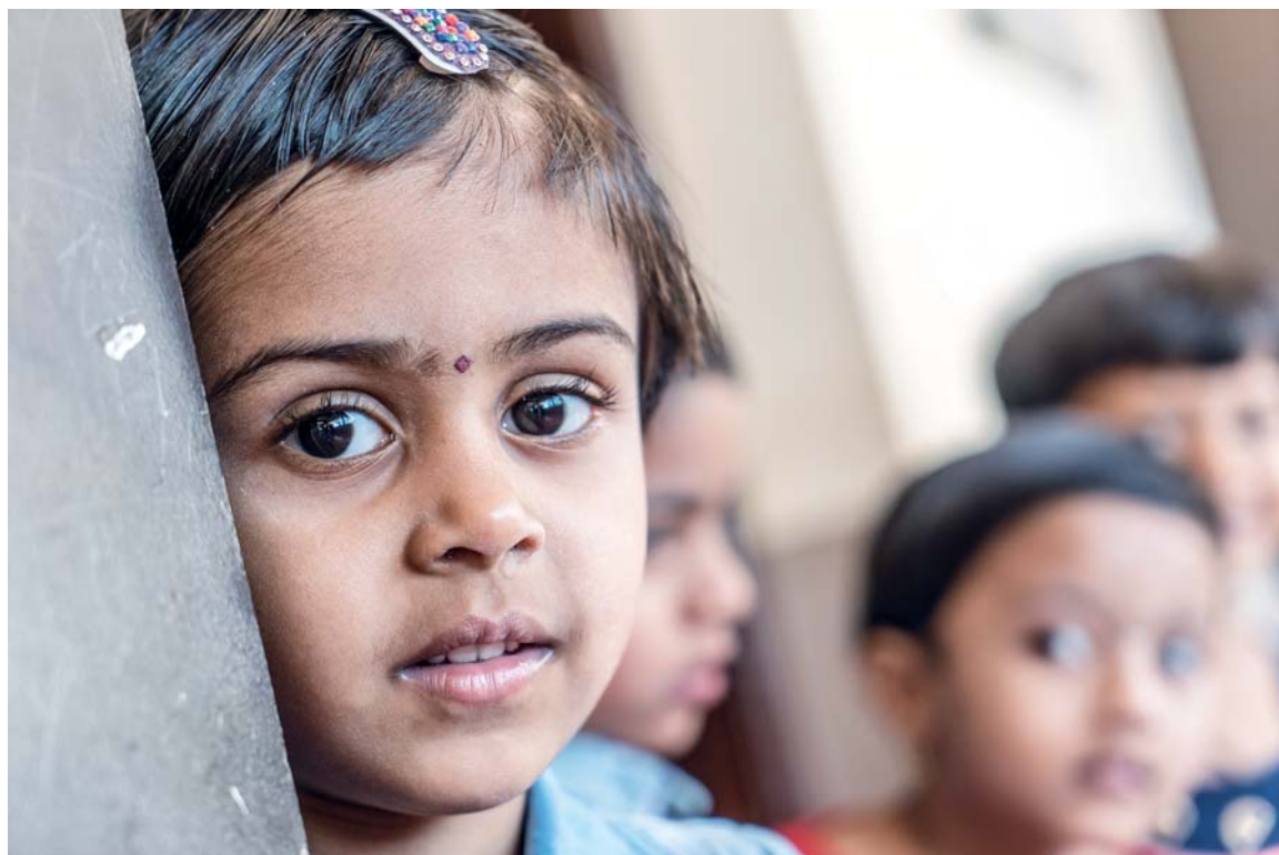
Věříme, že díky „Mariím“ má i tato holčička další budoucnost.

Když tisíc Marií daruje po tisíci korunách, pomohou doplatit novou školu pro chudé děti v Indii i její financování v těžké době pandemie koronaviru. Najděte si svou Marii, se kterou přispějete na tuto sbírku! Děkujeme!