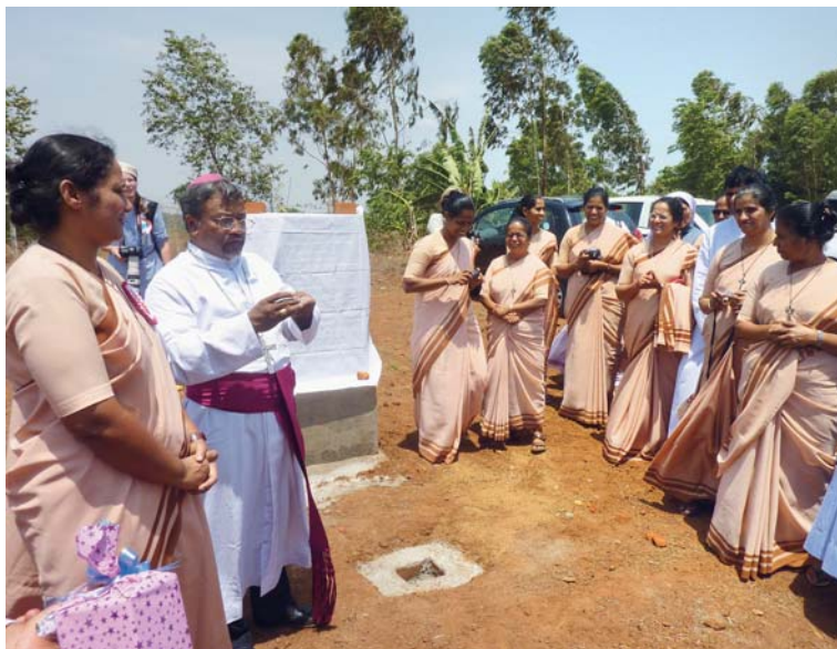
Požehnání základního kamene v květnu 2012.