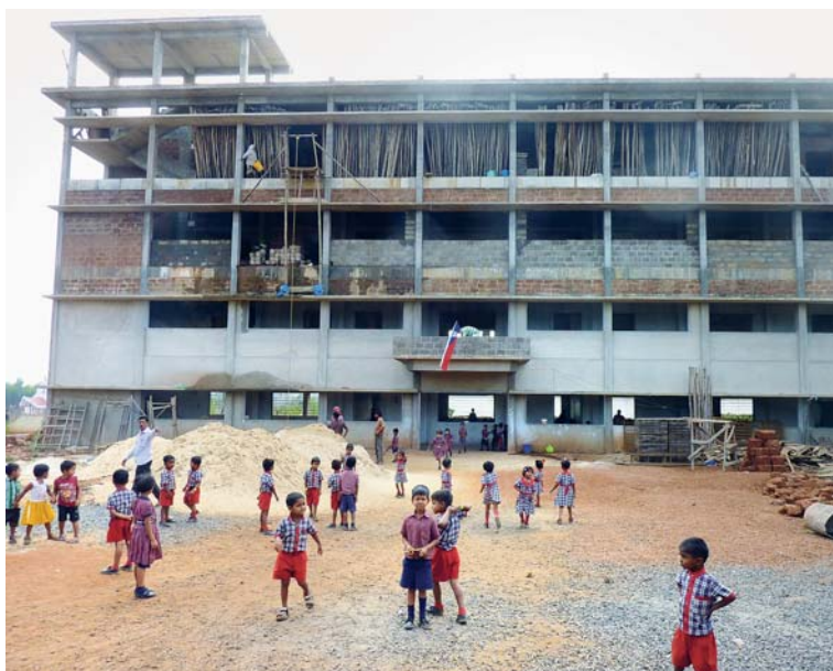
Stavební dohled zajišťovali budoucí školáci.