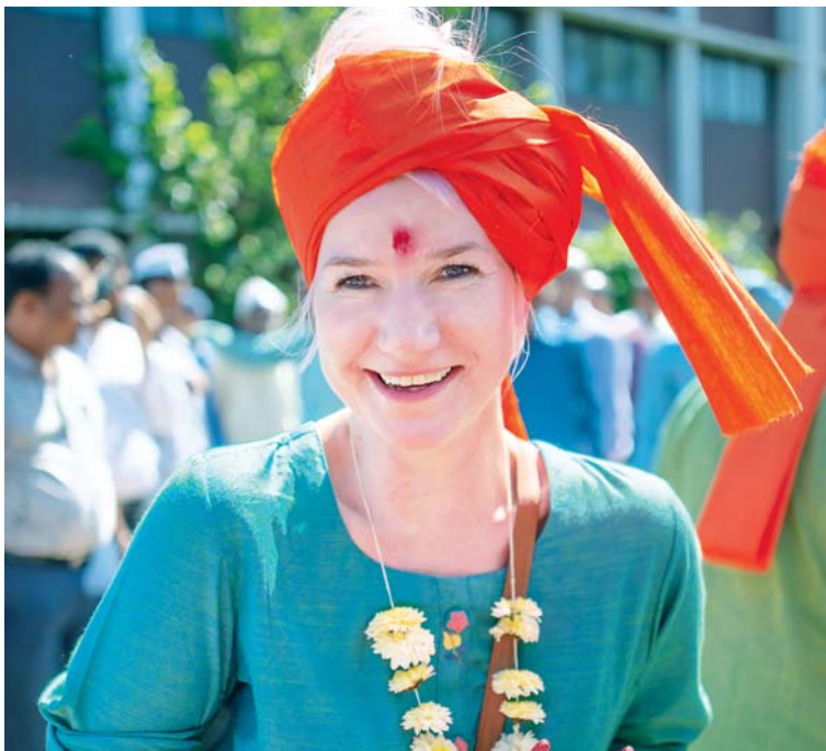
K práci fotografky také patří správná výzdoba.