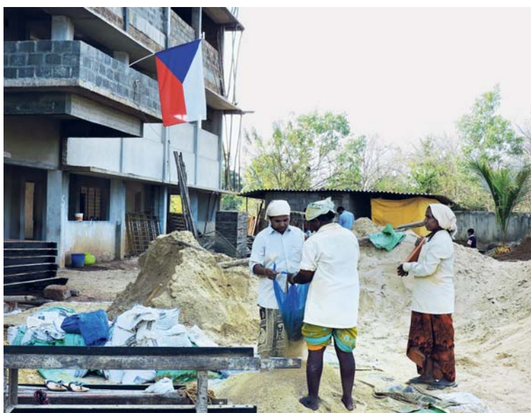
Místní ženy pomáhaly při pomocných pracích.