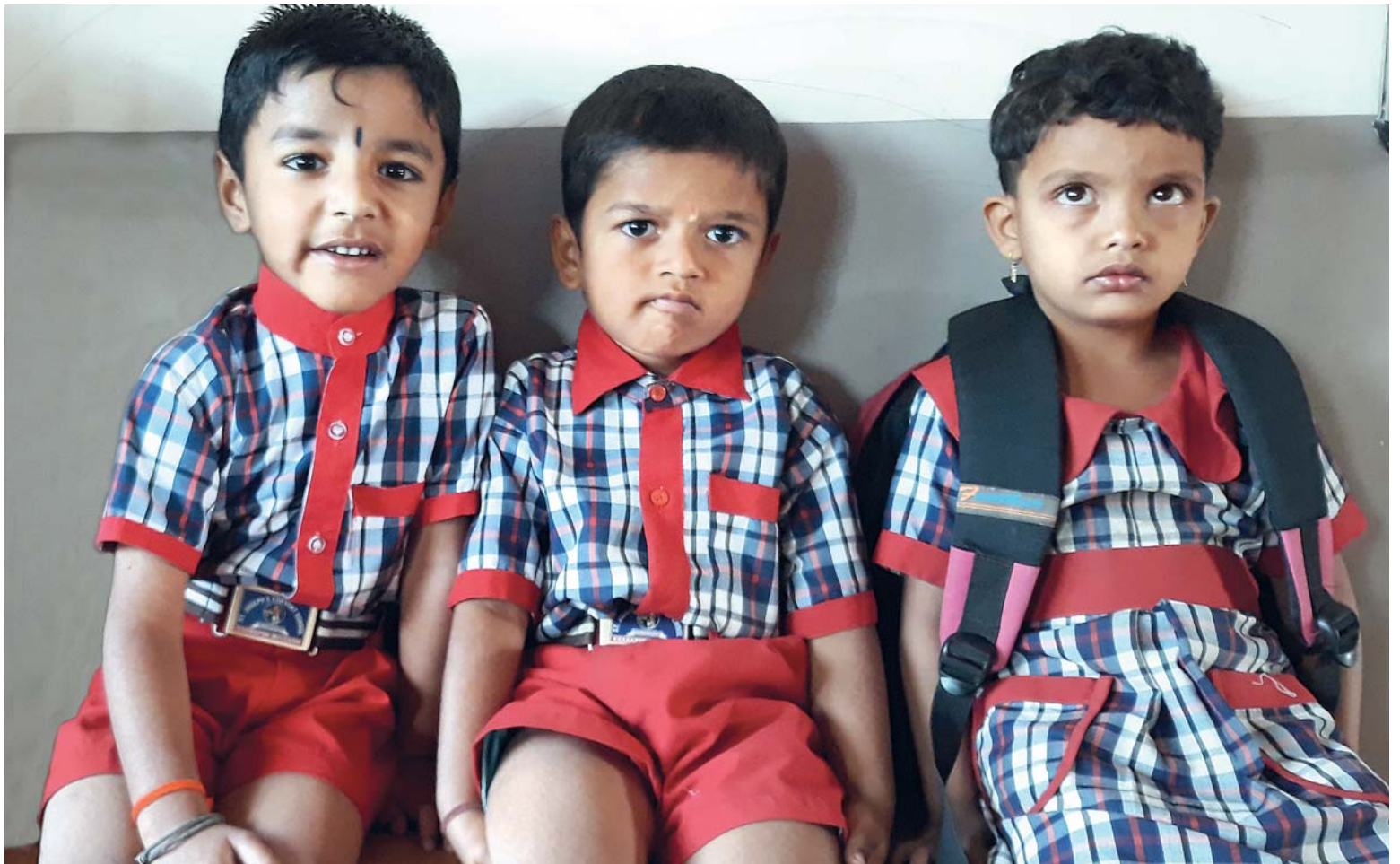
Předškoláci na lavičce za vzděláním.