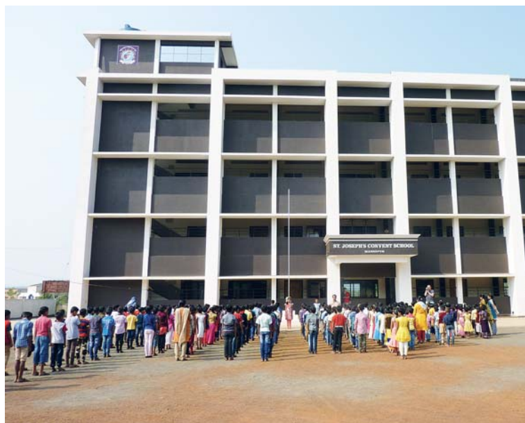
A toto je výsledek česko-indické spolupráce. Stavba dokončena v roce 2016.